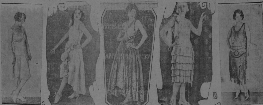
EL TRAJE DE NOCHE

SU MAJESTAD La Moda, por su igual confesionalmente al traje de noche de la orgulliosa tafeta, que al de telas suaves y blandas. Mostramos aquí la historia de la moda de noche en cinco cuadros. Comenzando por la izquierda: UN EXQUISITO modelo de traje de noche hecho de raso plateado, la falda tablonada y con ruedo terminado en puntas, luce un sencillo pero efectivo adorno en las mangas estrechas de la misma tela con motacillas plateadas. Avenne